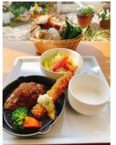
大人のお子様ランチ

★鳥取県産牛肉のデミグラス煮込み 季節の野菜添え スープ、サラダ付/¥1,580