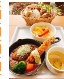
大人のお子様ランチ