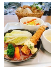
大人のお子様ランチ