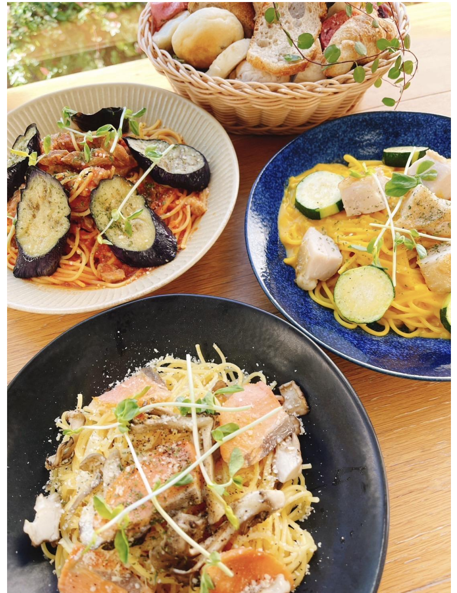
9月「秋のパスタフェア」