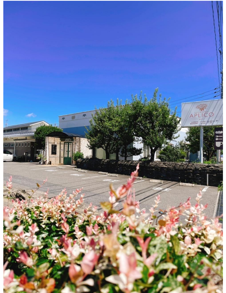
Café & bakery APLICO 店外