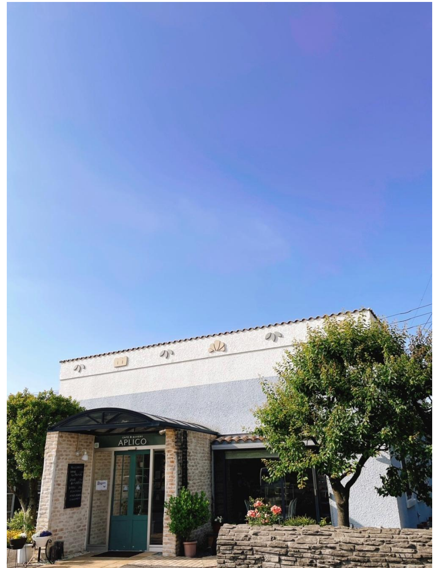
Café & bakery APLICO 外観