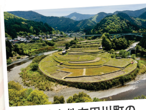
和歌山件有田川町の あらぎ島