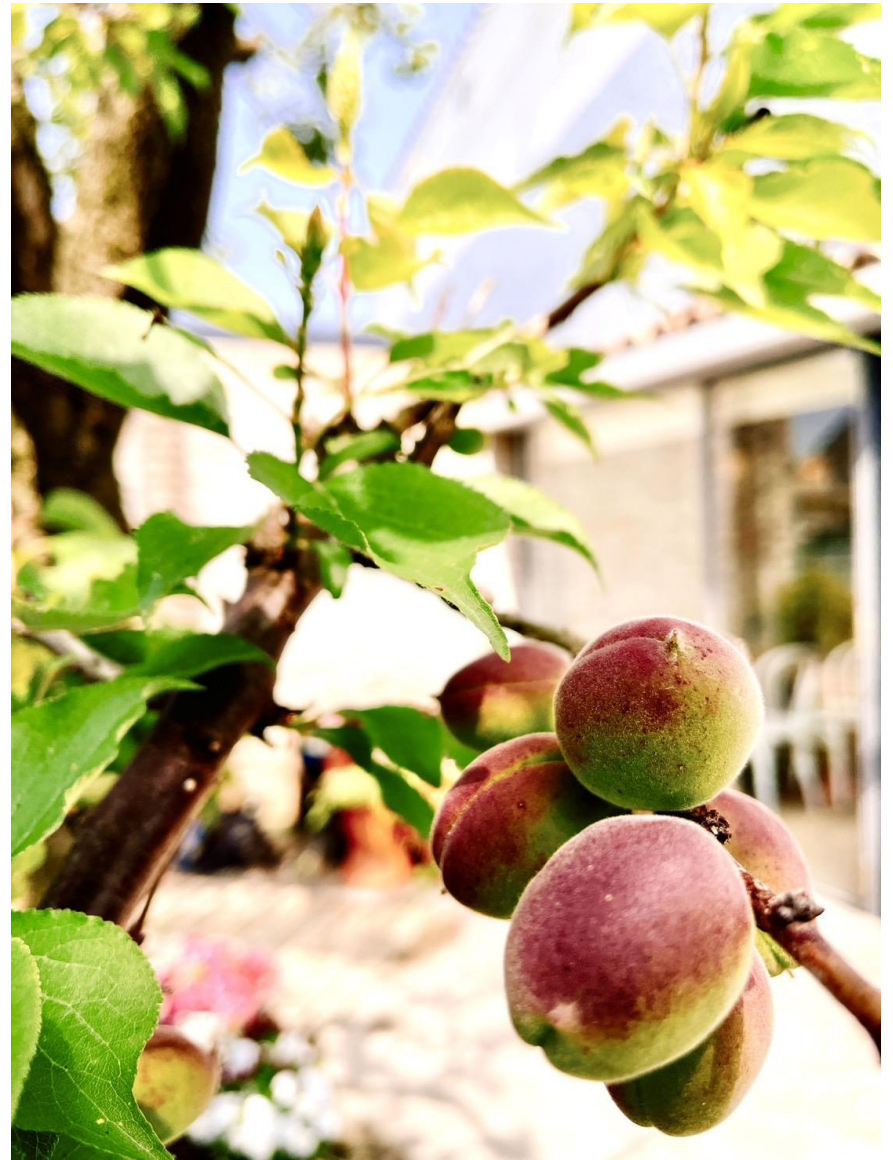
APLICOの庭のまだ青いアングの実