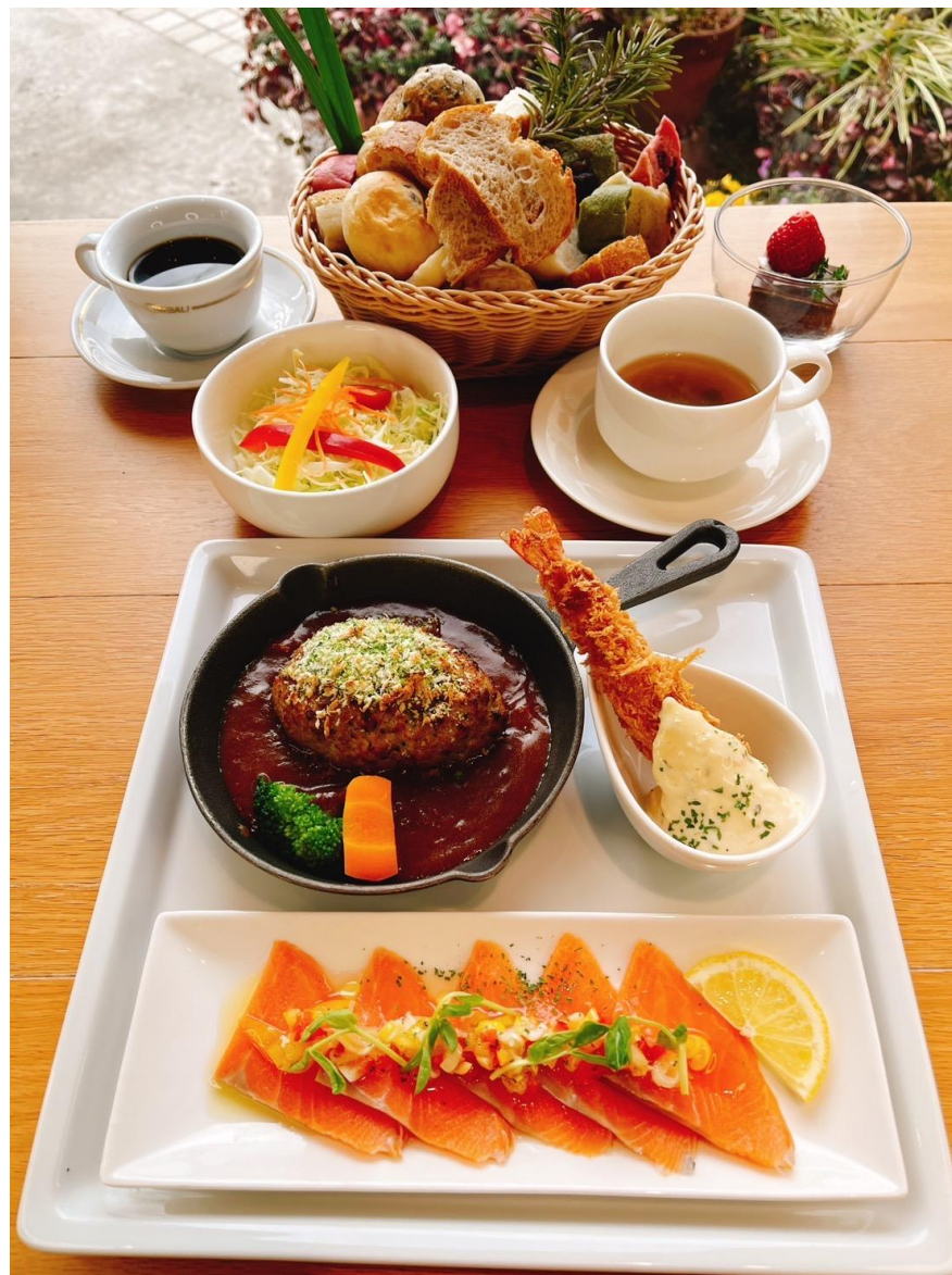
スモークサーモン(境港)付 大人のお子様ランチ