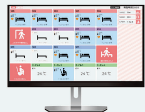
サービスステーション