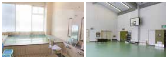
米子市中心身障害者福祉センター

ど多様な設備を備えており、これまでに、文化活動やスポーツ活動などの定期講座も開催されています。