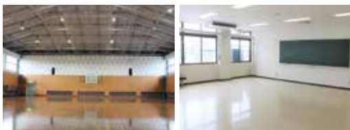
米子サン・アビリティーズ