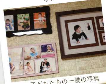
子どもたちの一歳の写真