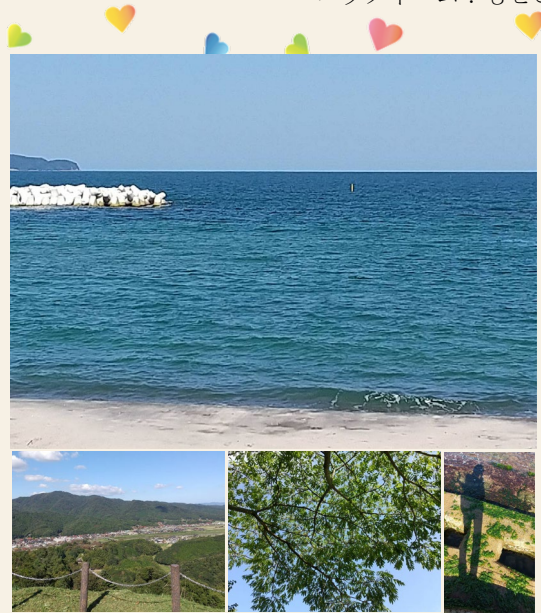
病気をしなかったら出会えなかった自然

いつか、すごく落ち込む日があり、その時、ちょうど娘のメモと出会いました。『おかあさんのことで、泣いて泣いて泣いた』と…。そのメモの出会いで『よーし！ がんばろう！』の気持ちに切り替わりました。続いて、息子から手紙に